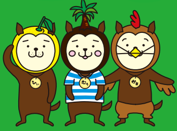
宮崎県シンボルキャラクター「みやぎき犬」